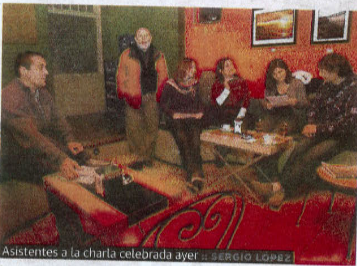
Asistentes a la charla celebrada ayer.